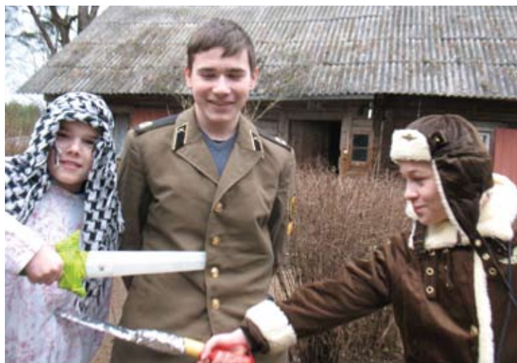
Kaimą nuo visokių negandų ginti pasirengę kariai - arabas, rusas ir amerikietis.