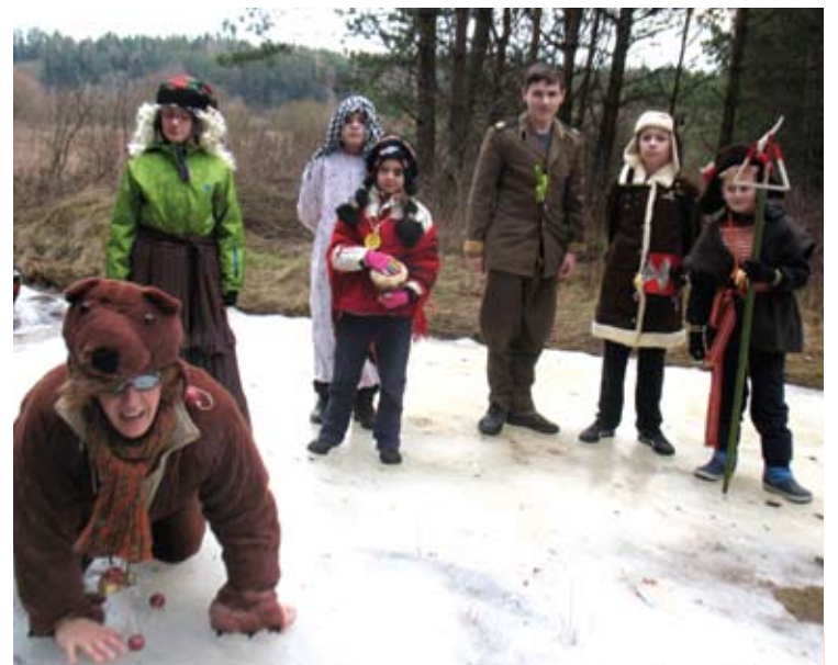
Šalčiausiame kaimo taške meškutė ir visa kompanija pasidžiaugė ledynu.