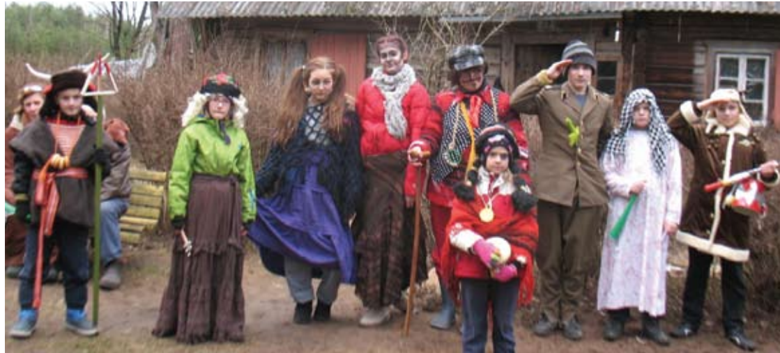
Persirengėliai pirmiausia sugužėjo į istorinę Jurgio Žvirblio sodybą Pamargavonėje.

Istoriniame Butėnų kaime, netoli Svėdasų, Užgavėnių šventėje pagrindinis veikėjas, kaip ir prieš šimtmetį bei anksčiau, buvo aukštaitiškas Gavėnas. Jo palydoje šėliojo ir velniai, ir raganos, žydukės, čigonas, pabėgėlių šeimyna ir mus ginti pasirengę įvairių tautų kareiviai.