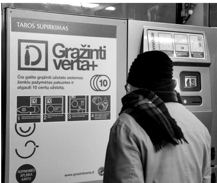
Anykštėnai domisi taromatu.

„Maximos“ parduotuvėje pirkėjai gali naudotis taromatu, į kurį jie gali mesti specialiu užstato sistemos ženklu pažymėtas plastikines, metalines ar stiklines pakuotes ir atsiimti 10 euro centų užstatą.