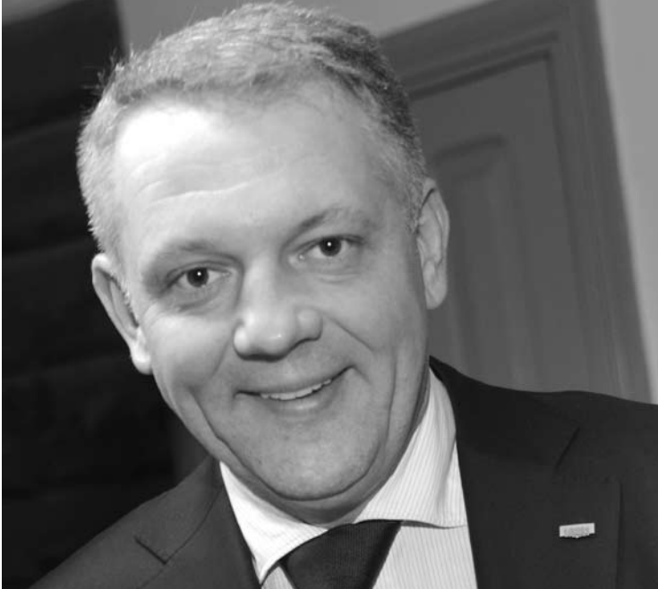
Liberalų sąjūdžio pirmininko Eligijaus Masiulio seneliai gyvena Anykščių rajone, todėl vaikystėje vasaras jis leido mūsų krašte.

Liberalų sąjūdžio pirmininkas, Seimo narys Eligijus Masiulis antradienį lankėsi Anykščių rajone. Politikas iš mūsų miesto išvyko tik vėl vakarą, po „Protų mūšio“ turnyro, o prieš tai dar spėjo atsakyti ir į žurnalisto klausimus.